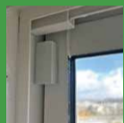
マグネット スイッチ